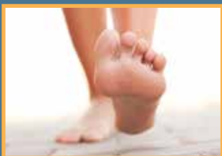
Beine & Füße

In diesen Körperregionen spielt die Nervenregeneration eine besonders wichtige Rolle.