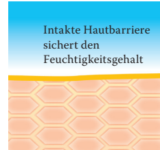
Intakte, schützende Hautbarriere mit Linolsäure-reichen Lipiden.

Besuchen Sie uns unter www.linola.de . Denn dort haben wir für Sie alle aktuellen Informationen über Linola Hautmilch , Linola Gesicht , Linola Hand und Linola Fuß-Milch sowie zu weiteren Linola-Produkten bei verschiedenen Hautproblemen bereitgestellt.